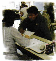
げつよう 月曜コース

この4月、私は日本語学習部の責任者を引き受けてし まった。某先輩から「人が良すぎる」と揶揄されたが、私 は、回り当番みたいなもの、一度その責任を果たせば暫 くはこの雑用から解放されるも のと信じている。この一年、ボラ ンティアの皆さんのご協力をお 願いいたします。